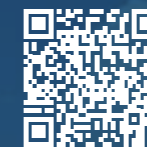
Augmented Situation Board