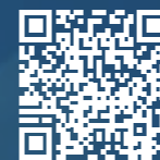
Smart Drone Rescue System